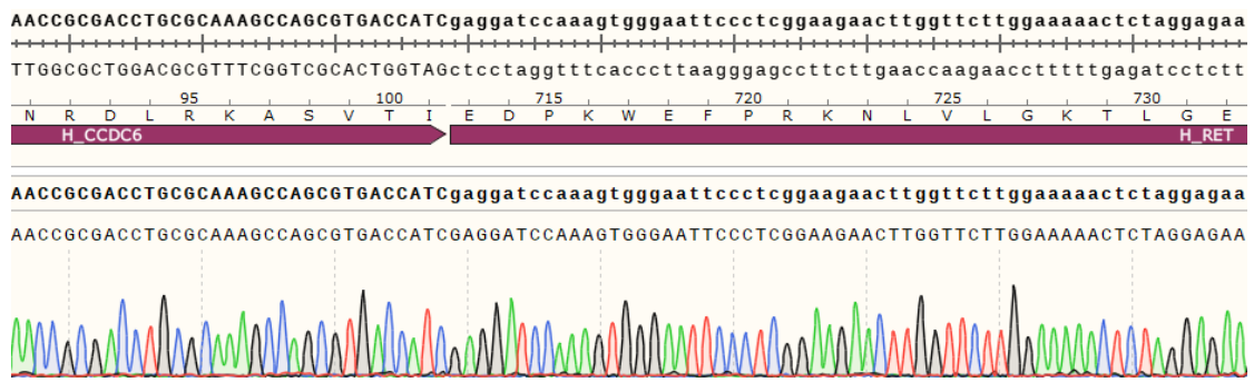
Fig 2. H_CCDC6-RET BaF3 Cell Line 测序结果